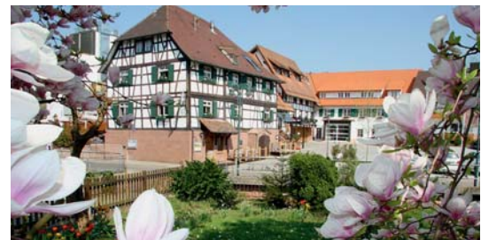
Hotels, Gastronomie und Gewerbe