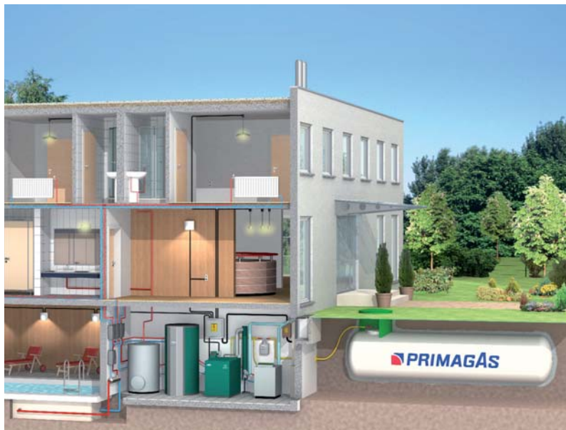
Elektrische und heizungstechnische Einbindung im Gewerbebetrieb mit dem Dachs SEplus

Die Zukunft liegt nicht in Heizsystemen, die Strom verbrauchen, sondern in Heizanlagen, die Strom erzeugen.