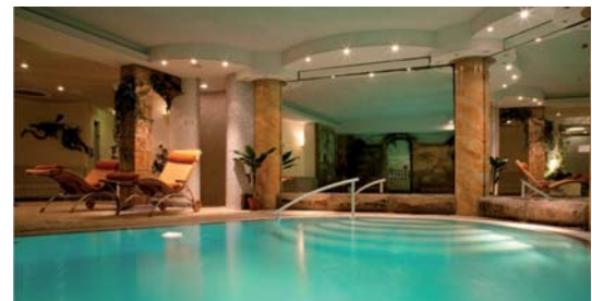
Schwimmbäder, öffentliche Einrichtungen